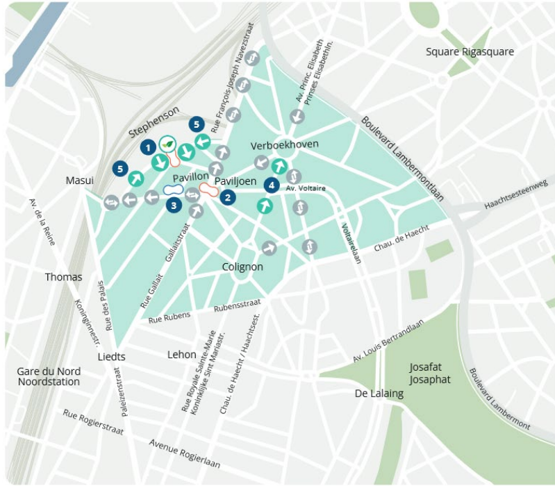
E.B. Collège des Bourgmestres et Echevins de Schaerbeek - V.U. Collège van Burgemeester en Schepenen van Schaerbeek